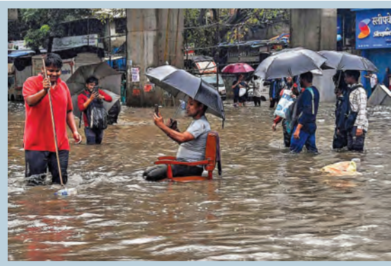
మంగళవారం ముంబయిలో మోకాలిలోనే నీటిలో ప్రజల అవస్థలు